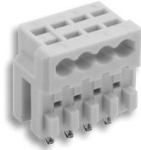
Darstellung vormontiert Designation pre-assembled

Series MF 7534 for ribbon cable for direct and indirect connection, for wire size 0.22 mm 2